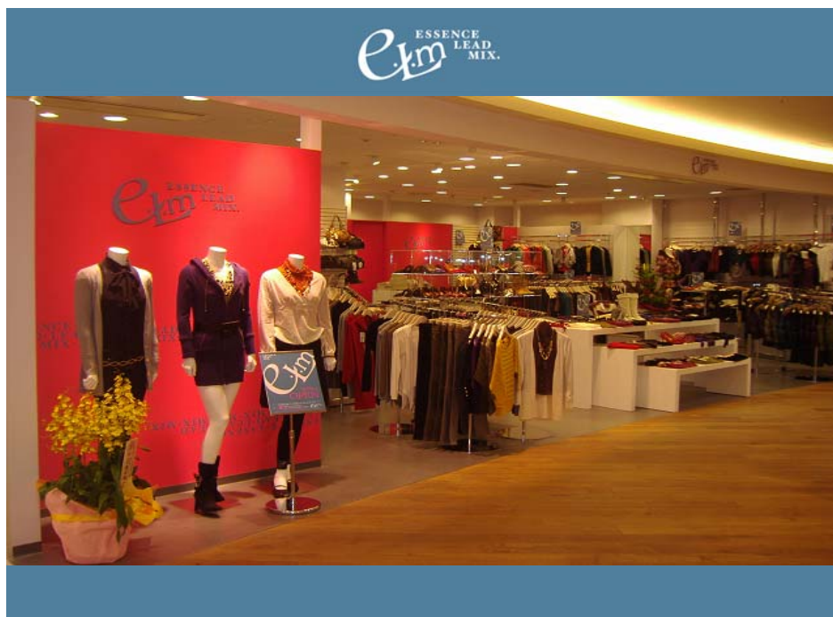
(お台場デックス店)

e.L.m マイング博多店 (2006年10月7日オープン) http://www.elleme.co.jp/go_15.html